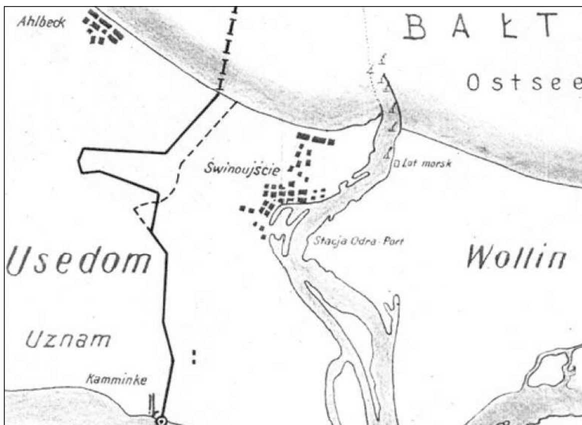
Abb. 1: Planzeichnung zum zukünftigen Grenzverlauf (Ausschnitt) aus der Spätphase der Verhandlungen zwischen der DDR und Polen mit der „spitzen Nase“. Zusätzlich eingefügt als gestrichelte Linie ist in dieser Wiedergabe die von 1945 bis Juni 1951 praktizierte Demarkationslinie, entnommen aus [3] Seite 86

bietszipfel (in Polen auch „Sack“ (pl. worek) genannt) von der DDR an Polen übertragen wurde. [4]