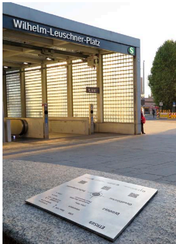
04107 Leipzig, Wilhelm-Leuschner-Platz